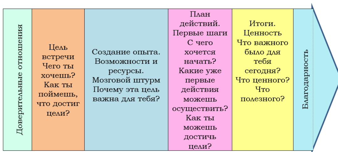
Рисунок 1.- Алгоритм проведения коучинговой беседы с учителем по обсуждению целей профессионального развития

Подробнее об указанных техниках и моделях можно прочитать во многих источниках, например, в книге М. Дауни «Эффективный коучинг». 17 Разработки уроков, выполненные с применением коучингового подхода можно найти на сайте «Коучингвобразовании.рф». 18